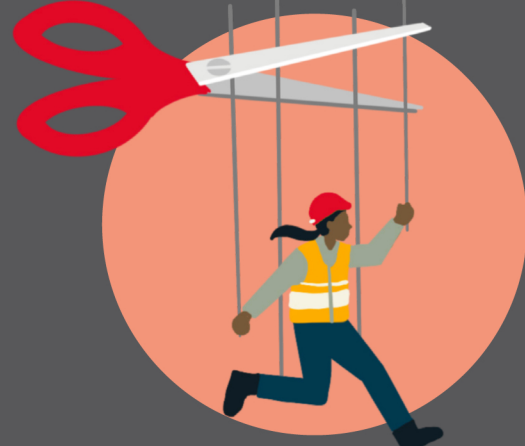
အာမခံချက်မဲ့သော အလုပ်အကိုင်များ၏ စီးပွား၊ လူမှု၊ ရုပ်ပိုင်းဆိုင်ရာ ထိပါးလွယ်မှု