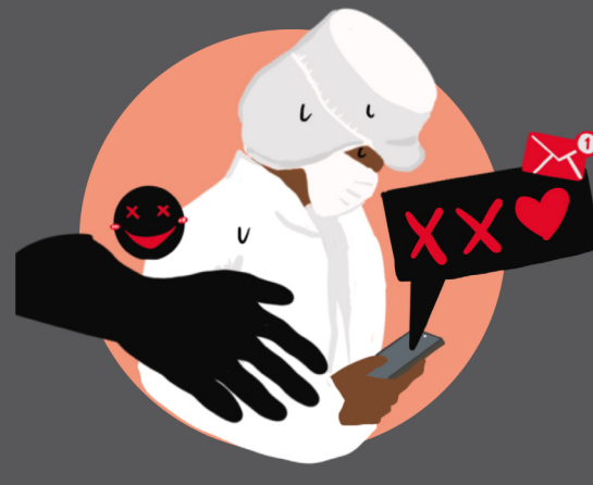
လိင်ပိုင်းဆိုင်ရာ နှောင့်ယှက်၊ တိုက်ခိုက် နှင့် အကြမ်းဖက်မှု