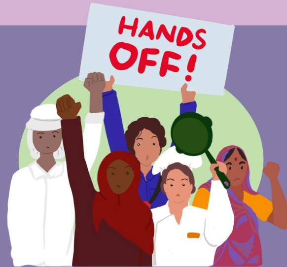
လိင်ပိုင်းဆိုင်ရာ နှောင့်ယှက်၊ တိုက်ခိုက်နှင့် အကြမ်းဖက်မှု တို့မှ ကင်းလွတ်သော ဘေးကင်းသည့် လုပ်ငန်းခွင်များ