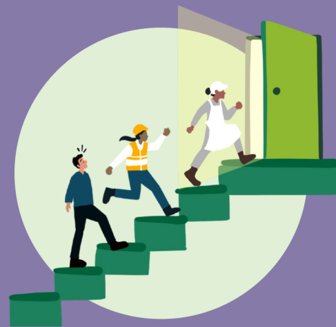
မျှတသော ပြုမှုဆက်ဆံမှု၊ အခွင့်အရေးများနှင့်တန်တူညီမျှရေး