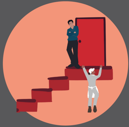
ခွဲခြားဆက်ဆံမှုနှင့် ကျား၊ မ တန်းတူ မညီမျှမှု