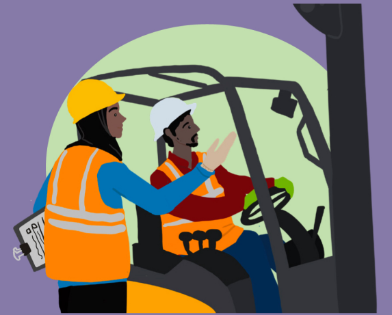
ဂုဏ်သိက္ခာနှင့် လေးစားမှုတို့ဖြင့် အလုပ်လုပ်ရခြင်း